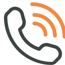
Call center assicurativo